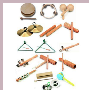
Instrumentos de Altura Indeterminada