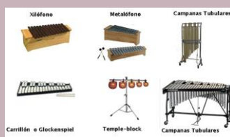
Instrumentos de Altura Determinada

3.2 Instrumentos Idiófonos: En estos instrumentos, el sonido se produce por la vibración que se genera al ser chocados entre sí, golpeados, agitados o raspados con algún objeto. Dentro de los idiófonos encontramos los instrumentos de altura determinada como los xilófonos, marimba, carrillones, campanas tubulares, etc., y los instrumentos de altura indeterminada como triángulo, caja china, platillos, maracas, etc.